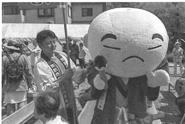
亀岡市で大河ドラマのPRにも一役