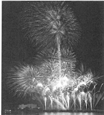
◀ 昨年 の花火大会

みなと舞鶴ちゃったまつり花火大会のフィナーレを飾る「みんなの花火」。ただいま、「まい花火募金」を受付中です。会社の仲間やご家族で、ぜひご協力ください。