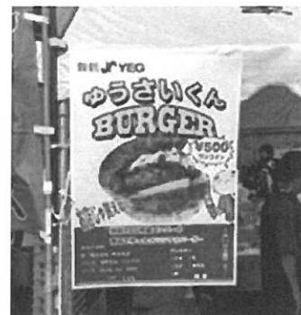
ゆうさいくんバーガーをPR

回は“ゆうさいくんバーガー”を初めて販売(写真右)。このバーガーは来年度の“40周年事業”の一つとして検討しているものです。約240個販売し好評でした。